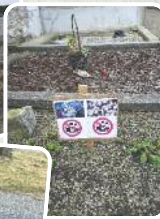
Plantations de plantes grasses entre les concessions