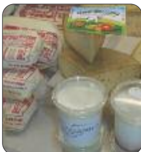
Les produits laitiers de la ferme des Cotaies