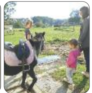
L'école des Poulains par Valérie Binje