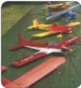
Aéromodélisme par Bruno Scordo

Encore bravo à toutes et tous et un grand merci ! Un drink de remerciement a eu lieu le 25 octobre dernier sous la forme d'une soirée « auberge espagnole ». Les ambassadeurs ont eu l'occasion de partager leurs expériences en toute convivialité. Les photos prises durant ce week-end découverte ont défilé sur écran géant. Voici une sélection non exhaustive des activités proposées. Découvrez-les toutes sur la page Facebook de l'ADL Villers-le-Bouillet.