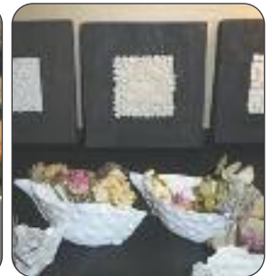
Les créations en céramique de l'atelier Artèrè3