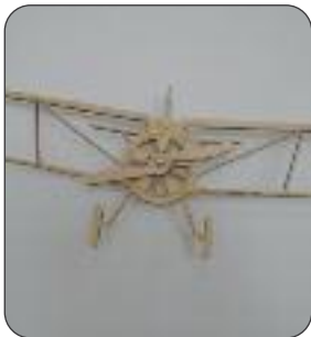
Découpe laser par Procut laser