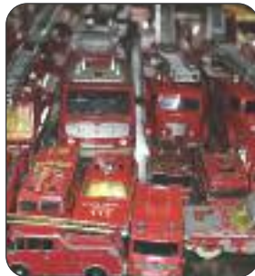
P. Meys et ses petites voitures