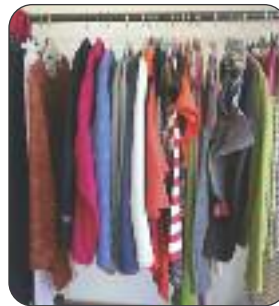
Création de vêtements et accessoires par les P'tits Chiffons de Clara