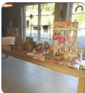
Ma bouche de crochet par Marie-Annick Delye