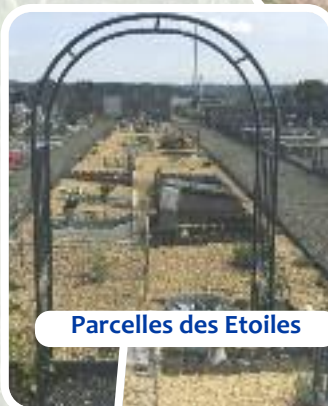
Parcelles des Etoiles