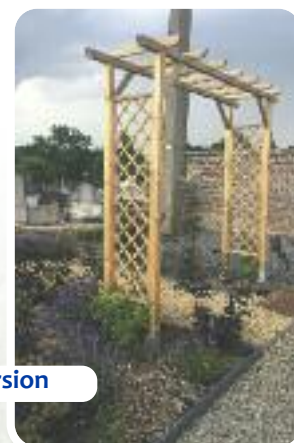
Aire de dispersion