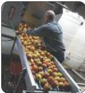
Fabrication de jus de pommes par Délice de Marie