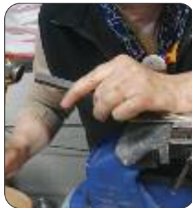
Gravure par Isabelle Fairon