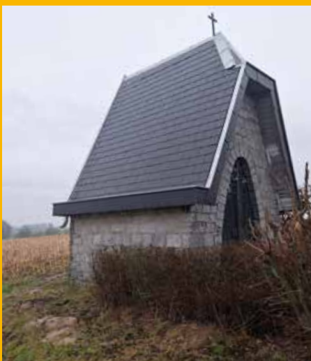
Une nouvelle toiture.

Des travaux de rénovation extérieure de la chapelle Saint-Jean sont actuellement menés par la Commune de Villers-le-Bouillet. Situées rue Saint-Jean à Warnant-Dreye, elle a déjà subi une restauration intégrale de sa toiture en ce début d'année 2024. Les façades vont également bénéficier d'un petit coup de frais dans les prochaines semaines. Cette restauration a été subsidiée par la Cellule du petit Patrimoine Populaire Wallon de l'Agence du Patrimoine Wallon pour un montant de 7.500€. Le montant global de ces travaux de restauration s'élève à 13.600€ TVAC. ■