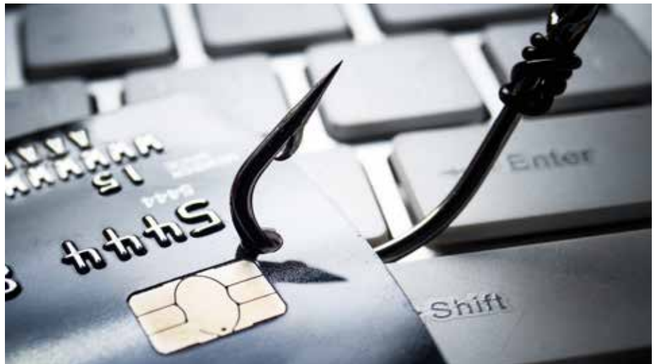
Via le phishing, les fraudeurs tentent d'accéder à vos données.