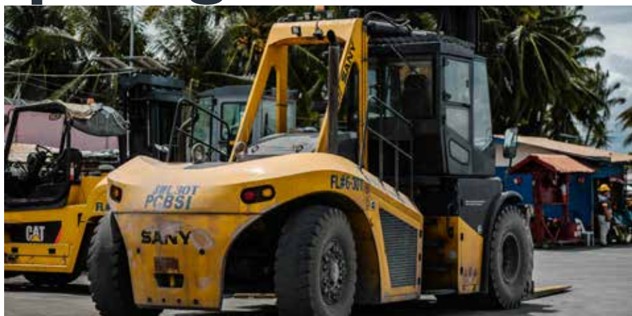
Un montant supplémentaire de 165.000€, dont 15.000€ payés par les entreprises.

A Villers-le-Bouillet, la Commune a toujours géré en interne le recensement des moteurs sur son territoire. Constatant qu'il en allait là d'une tâche technique et d'un levier financier négligé, j'ai suggéré, en vue