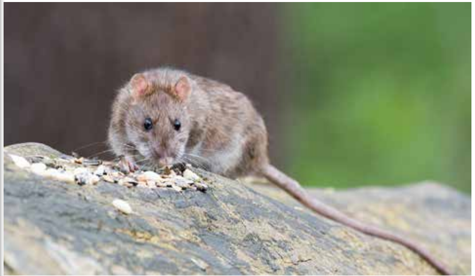
La campagne est entièrement gratuite pour la population.

La Commune de Villers-le-Bouillet relance une campagne de dératisation de son territoire. Cette première campagne de l'année 2024 sera menée entre le 15 et le 19 avril. Elle s'adresse à tous les habitants du territoire de Villers-le-Bouillet, mais ne concerne pas les fermes et sociétés agricoles.