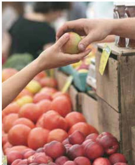
Plusieurs vendredis par mois.