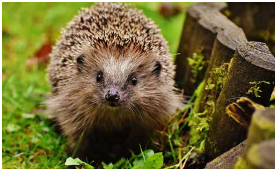
Le hérisson se réfugie de plus en plus dans les jardins et les parcs.

Ne trouvant plus ni le gîte, ni le couvert dans les zones agricoles, les hérissons se réfugient dans les jardins et les parcs. Là, de nombreux dangers les guettent. Les clôtures les obligent à passer sur des routes où ils se font écrasés. Certains jardins sont traités aux pesticides, d'autres jardiniers utilisent des anti-limaces et/ou des rati-