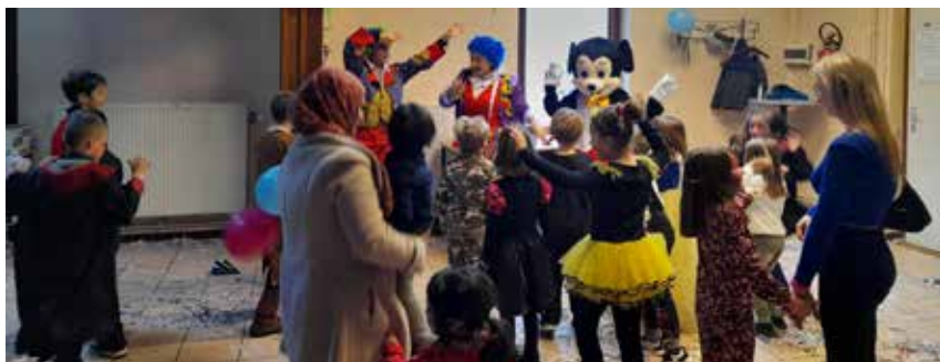
Mickey était l'invité surprise de cette deuxième Carna'Boum.

Le vendredi 01 mars avait lieu la Carna'boum ! Cette 2ème édition a réuni une trentaine d'enfants âgés de 7 à 10 ans ! Tous les participants étaient déguisés pour l'occasion : Cowboys, Harry Potter, Super-héros, Princesses... Au programme : musique, petits jeux, grimage, friandises, cotillons et serpentins ! Une chouette après-midi pour tous, l'ambiance était bien au rendez-vous ! ■