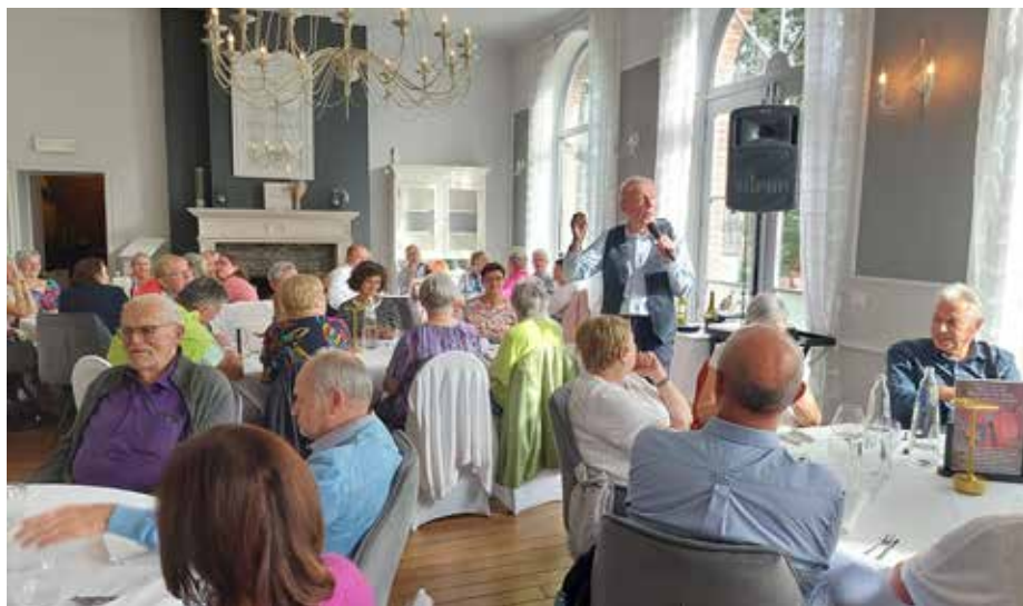
Le CCCA a organisé un repas convivial afin de recueillir les envies des seniors.

bus itinérant, réitérer ses vœux de mariage, la commune qui dit oui au wallon, fêtes de villages, de quartier, repas conviviaux, voyages, excursions, marches guidées, gymnastique douce, tricot, activités artistiques, utilisation d'internet, recyclage permis de conduire... ;