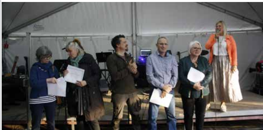
Les lauréats 2022.

Récompenser les initiatives se déroulant sur le territoire de l'entité de Villers-le-Bouillet ou ayant un lien direct avec la commune ou promotionnant Villers-le-Bouillet, c'est l'objectif des Mérites villersois. L'appel à candidatures pour l'édition 2023 de ces Mérites villersois est ouvert jusqu'au 4 septembre 2023.