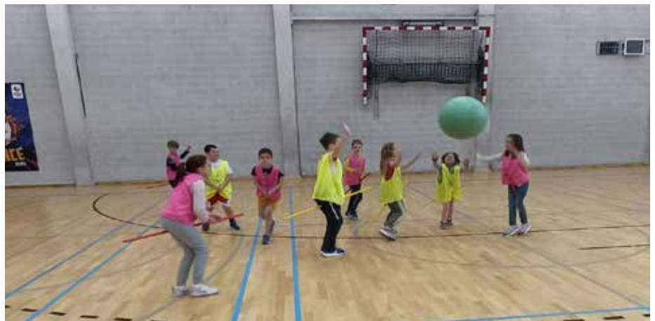
Une découverte ludique de différents sports.

Sports raquettes, sports collectifs, sports individuels, sports découvertes, arts martiaux... Le panel proposé est large et permet aux enfants de goûter aux différents axes existants dans le milieu du sport. Concrètement, les enfants ont l'occasion