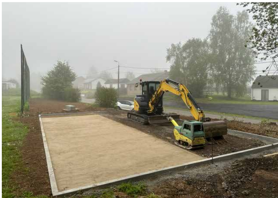
Les agrès seront placés durant l'été sur la dalle déjà érigée.

Par la suite, le village de Warnant devrait être équipé d'une aire de jeux dans le courant de l'année 2024. Là, c'est un skatepark qui verra le jour sur