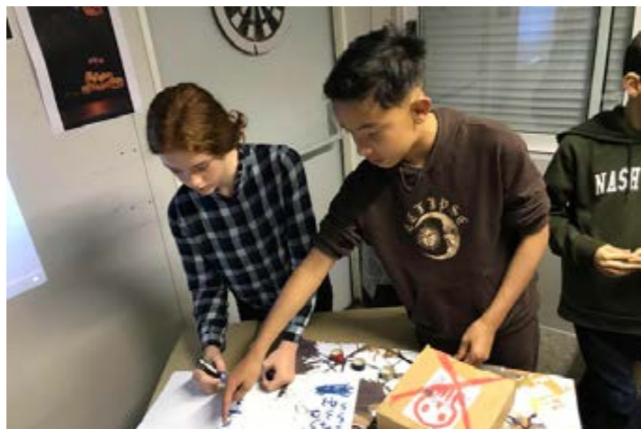
Des ateliers créatifs organisés le mercredi après-midi.

Pour rappel, le Local est ouvert chaque mercredi après-midi de 13h30 à 16h30 sur inscription préalable. Il se situe au Clos de la Panne-