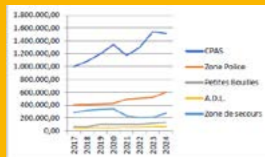
Evolution des dépenses de transfert.