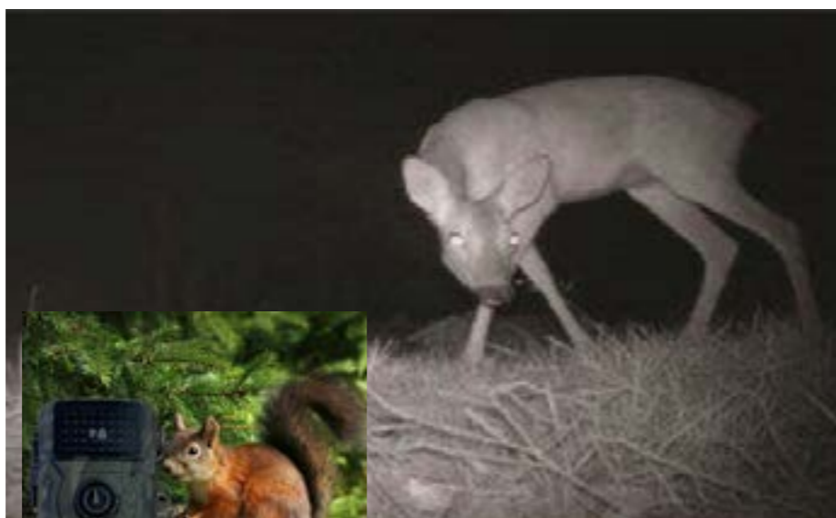
Une caméra dans le jardin permet d'observer la faune.

Le PCDN de Villers-le-Bouillet, dans un projet de sciences participatives, souhaite pouvoir vous aider à répondre à toutes ces questions en vous invitant à accueillir une caméra pendant 15 jours dans votre jardin. L'idée étant de déplacer la caméra dans l'ensemble de votre jardin pour avoir une idée la plus complète possible des visiteurs nocturnes et diurnes. Passé ce délai, nous récupérerons la caméra et les images seront analysées et commentées ensemble. Les séquences les plus cocasses seront sélectionnées pour une soirée