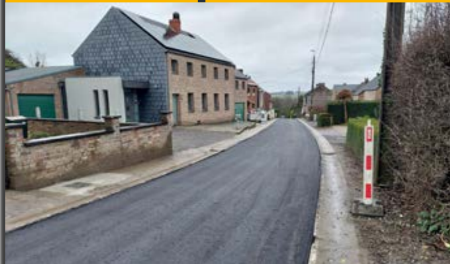
La couche d'usure sera posée au printemps rue Hochets.

P lusieurs importants chantiers sont toujours en cours à Villers-le-Bouillet et ont un impact plus ou moins important sur la mobilité. Le plus avancé d'entre eux est sans aucun doute celui de la construction d'une nouvelle voirie de contournement de la rue Roua à Warnant-Dreye. Cette route qui reliera le rond-point construit au niveau de la sortie 7 Huy/Braives de l'autoroute E42 au site de Carmeuse à Moha, prend forme et devrait être terminée au printemps prochain. Elle permettra d'éviter la circulation de plusieurs centaines de poids-lourds par jour dans la rue Roua.