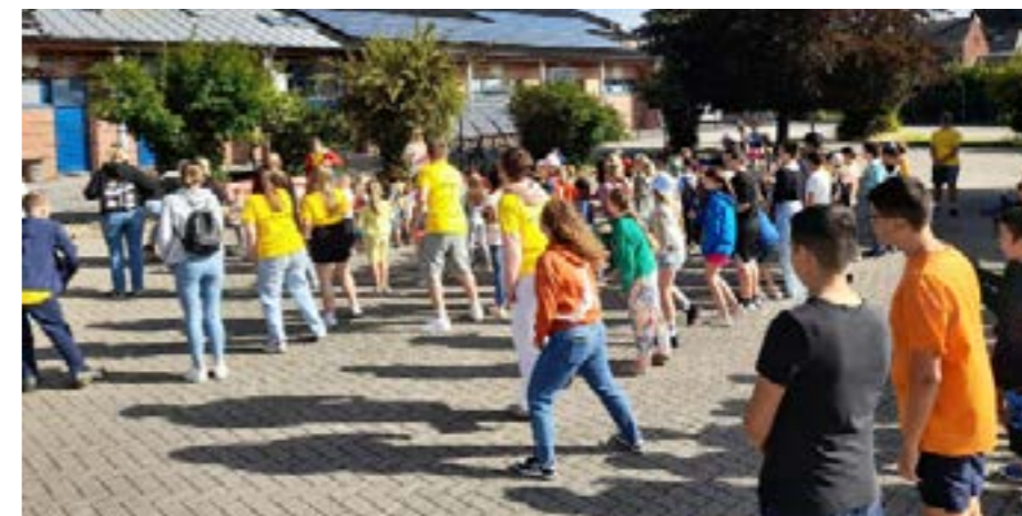
Des animateurs recrutés pour assurer l'amusement à la cure de plein air.

La cure de plein air prend son nouveau rythme de croisière en 2024 avec une édition estivale qui se déroulera du 8 juillet au 2 août, soit 4 semaines au vu du nouveau rythme scolaire. Les inscriptions s'effectueront de nouveau uniquement en ligne, via le portail parent présent sur le e-guichet de la Commune de Villers-le-Bouillet. Elles seront ouvertes à partir du lundi 15 avril 2024. Avant cette date, aucune inscription ne pourra être effectuée.