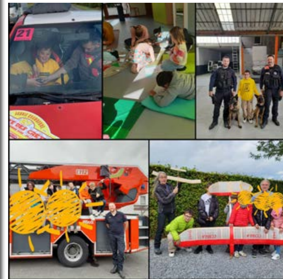
L'opération « Place aux enfants » a suscité des vocations.

Les Services Jeunesse et Accueil Temps Libre ont mis en place différentes activités à destination des plus jeunes Villersois ces derniers mois.