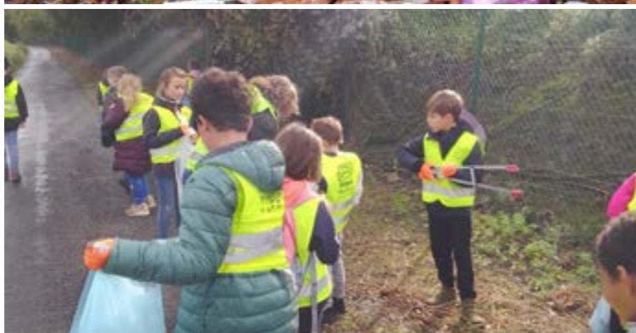
Des actions de sensibilisation ont été menées par l'Agent constatateur.