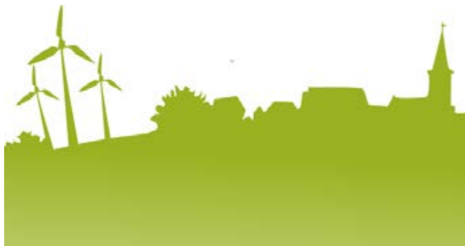
La Politique Locale Energie Climat vise à réduire les émissions.

Afin de parvenir aux objectifs fixés, des coordinateurs POLLEC sont appelés à intégrer les communes faisant partie de la Convention des Maires. Il tient le rôle de metteur en œuvre des objectifs requis par la Convention des Maires. Le but final de cette démarche est la concrétisation d'actions au sein du territoire de la commune