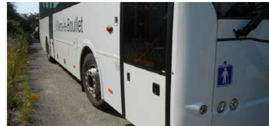
Le car communal était en fin de vie, une solution était nécessaire.

S'est alors posée la question du choix : investir dans un nouveau car communal, ou externaliser les transports en recourant au privé. Un calcul objectif des coûts, effectué par les services communaux, a amené le Collège, suivi par le Conseil communal, à poser le choix de l'externalisation.