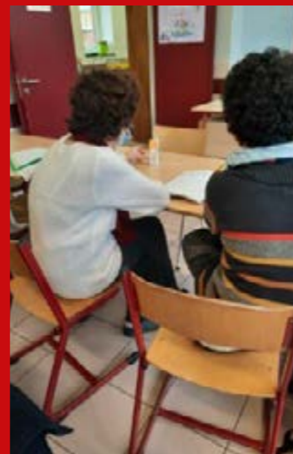
Chaque lundi et mardi.

Cette action est possible grâce au soutien de la Wallonie. ■