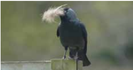
Un Choucas des Tours.

D'autres oiseaux, bien souvent mal aimés, se font entendre également en cette saison. On les appelle les Corvidés : le Choucas des Tours (qui squatte parfois nos cheminées), la Corneille noire et le Corbeau en font partie, sans oublier la Pie bavarde qui porte bien son nom.