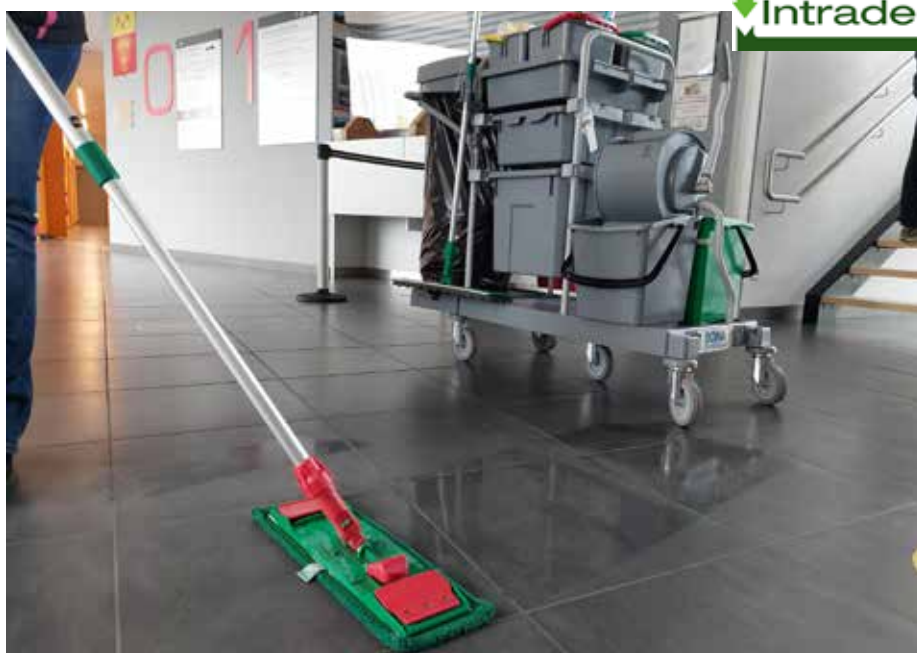
Les sols sont nettoyés au savon noir à l'administration communale.

L'ensemble du personnel d'entretien communal a tout d'abord suivi une formation donnée par Intradel. Un premier contact avec cette pratique qui leur a permis d'en apprendre plus et de se former à la préparation des