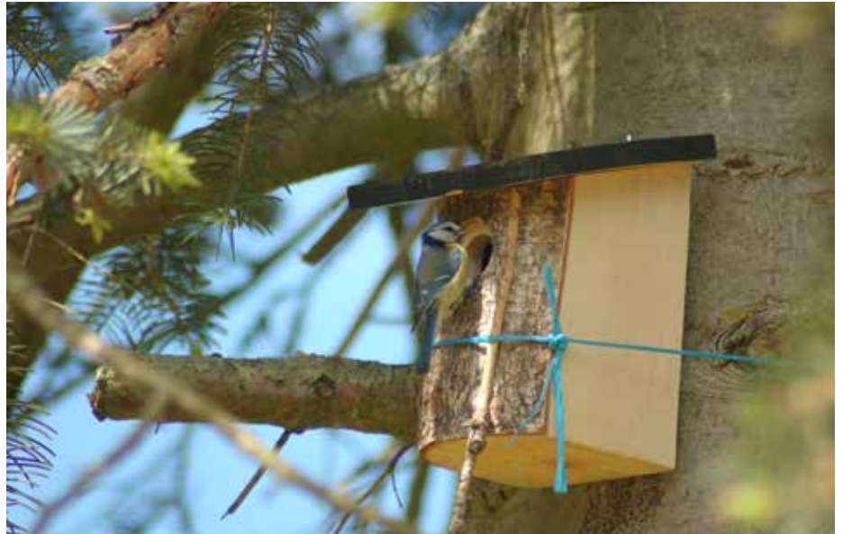
Les oiseaux, petits ou grands, recherchent un nid ou nichoir.

Il est grand temps pour tous ces oiseaux, du plus petit au plus grand, de penser à construire leur nid, à rechercher un nichoir douillet pour s'y installer ou de retrouver celui de l'année passée, dans lequel ils ont peut-être même déjà dormi tout l'hiver. C'est une évidence pour eux, un cycle perpétuel nécessaire et vital.