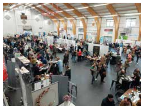
45 exposants présents.

45 exposants ont accompagné les visiteurs dans leur recherche d'emploi et/ou de formation, mais également dans leurs démarches de réorientation professionnelle. Employeurs, organismes de formation, centres d'in-