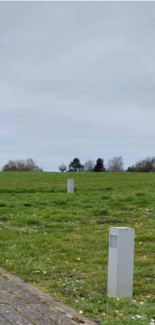
vous indiquent le bon chemin.