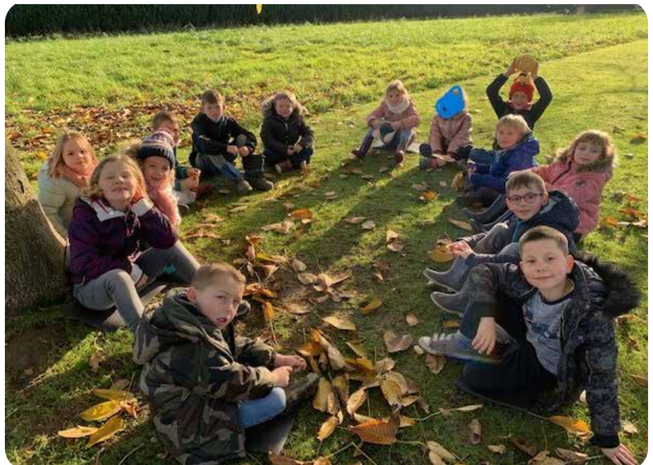
Les élèves de P1-P2 profitent régulièrement du site de la Sablière.

Nous sortons régulièrement dans le jardin de l'école, dans un verger privé, à l'arboretum et sur le magnifique site de la Sablière, accompagnés de nos enseignants et une 1 fois par mois, d'une animatrice du Centre Ré-