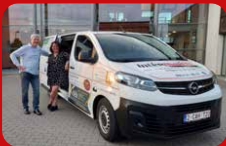
Deux Vilé'bus au CPAS.

Le Vilé'bus, le service de transport social du CPAS, a modifié ses tarifs depuis le 1 er avril 2023.