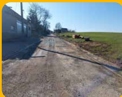
L'égouttage est terminé.

Les travaux d'égouttage et de réfection de la rue de la Sablière avancent selon le planning prévu. Après un mois de chantier, l'égouttage était terminé. La deuxième phase, celle relative à la réfection de la voirie et à la création d'un trottoir, a débuté mi-mars. Elle devrait se terminer au plus tard fin août. Ces travaux demandent un budget de 921 777€. ■