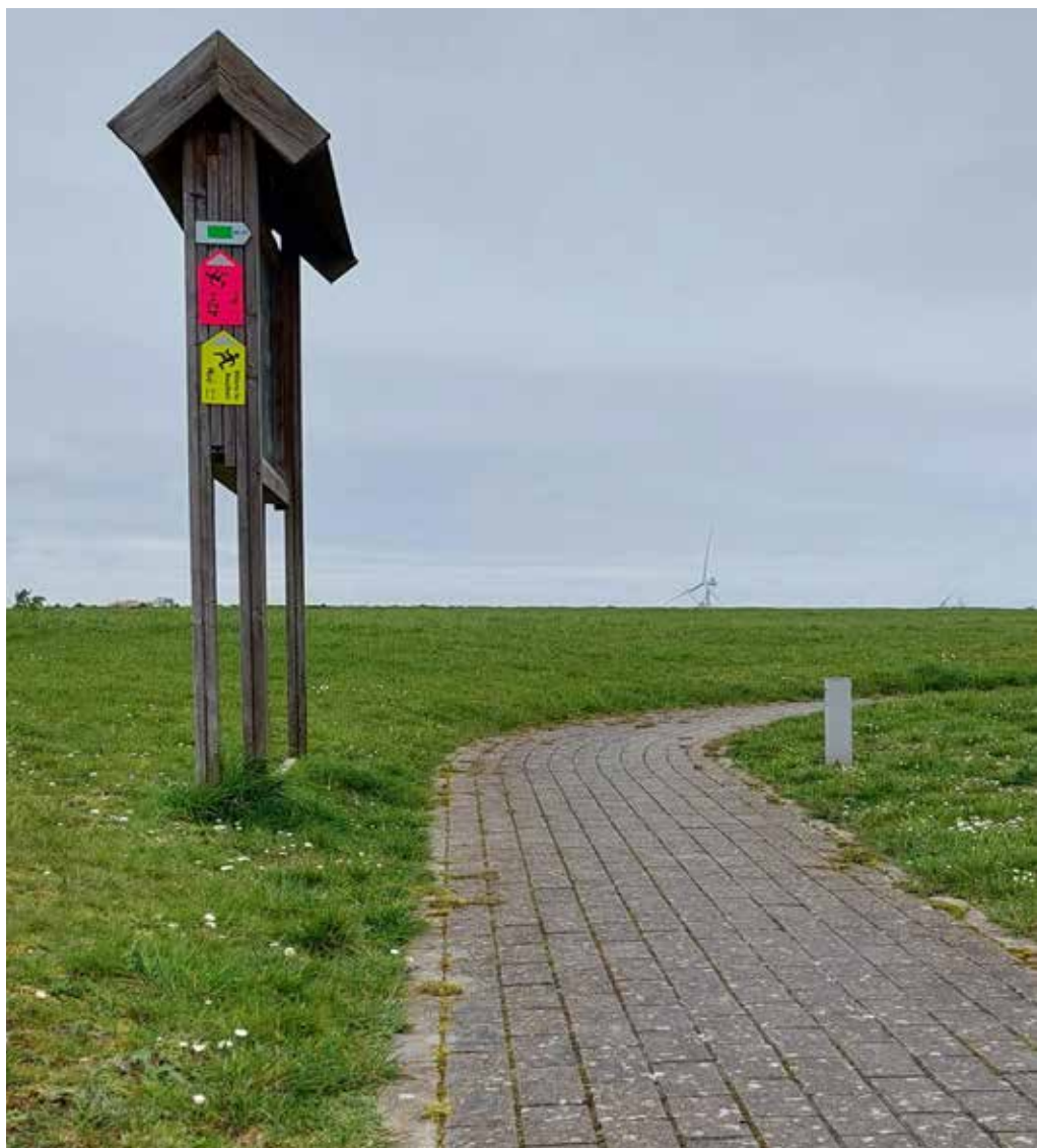
Des balisages directionnelles de couleur jaune, verte, bleue, rouge ou magenta

Longue de 11 km, cette balade vous permettra de découvrir toute la beauté du village de Warnant-Dreye. Ses moulins, son château, ses fermes