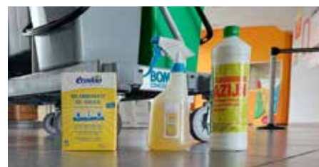
Les produits utilisés.

d'éliminer les produits chimiques allergènes et parfois irritants présents dans les produits ménagers traditionnels.